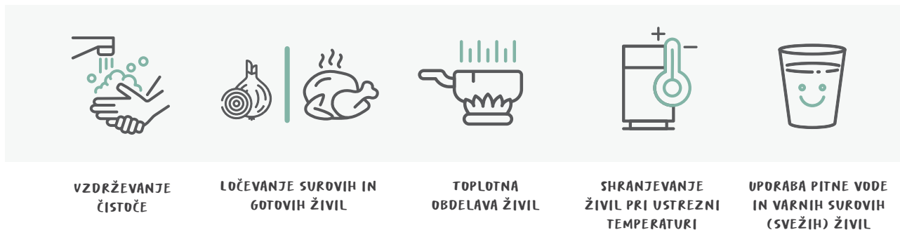
Slika 3: Pet korakov do zagotavljanja varne hrane doma