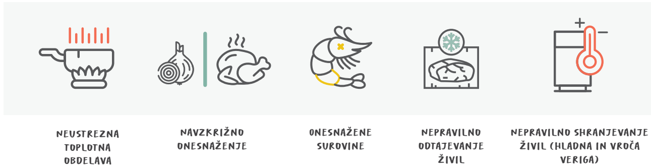
Slika 2: Najpogostejše napake, ki povzročajo okužbe in zastrupitve z živili

Pomanjkljivo znanje in nepravilno ravnanje pri pripravi živil sta pogostejša pri skupinah potrošnikov, kot so mladi odrasli (od 18 do 29 let), moški in starejši od 60 let (Burke in sod., 2016; Byrd-Bredbenner in sod., 2013; Jevšnik in sod., 2008b). Slabe higienske prakse pri pripravi živil doma, ki povzročajo okužbe in zastrupitve z živili, so lahko nevarne predvsem za občutljive skupine ljudi , kot so otroci, nosečnice, starejši in ljudje z oslabilnim imunskim sistemom (Abbot in sod., 2009; Byrd-Bredbenner in sod., 2008), zato je treba glede tega posebno pozornost posvetiti navedenim skupinam.