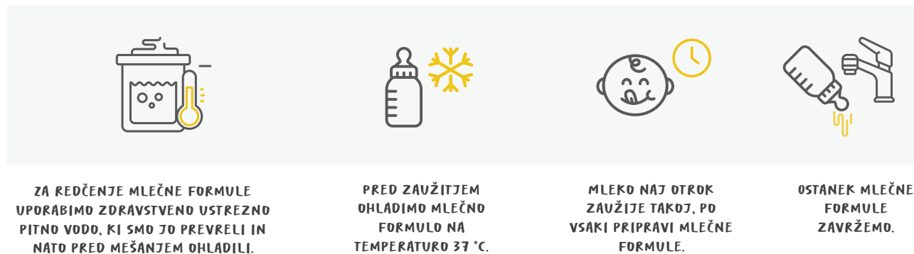
Slika 7: Priprava mlečne formule

Svetovna zdravstvena organizacija in Organizacija združenih narodov za prehrano in kmetijstvo (WHO in FAO, 2009) sta oblikovali glavne ukrepe priprave in ravnanja z mlečno formulo (slika 7).