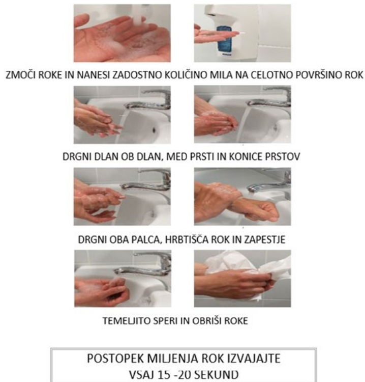
Slika 4: Postopek umivanja rok

Pri pripravi hrane moramo poskrbeti, da so vse delovne površine, posoda, pribor in pripomočki, ki jih bomo uporabljali, čisti. Prav tako jih je treba očistiti takoj po stiku s surovim mesom, perutnino, ribami in morskimi sadeži.