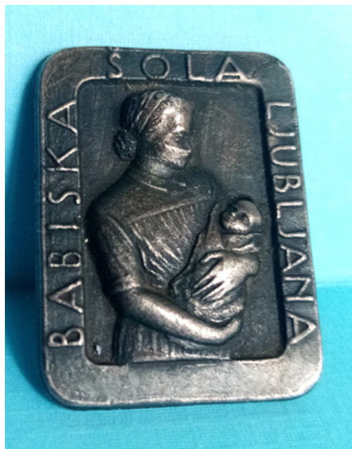
Značka Babiške šole v Ljubljani. Podeljevali so jo v 50. in zgodnjih 60. letih prejšnjega stoletja.

Po vojni, ko so se razmere umirile in se je znova vzpostavilo mirno stanje, so slovenske babice začele z obnovo društvenega življenja in obnovo stanovske organizacije, začele so z delom za izboljšanje svojega položaja in zopet je začel redno izhajati Babiški vestnik.