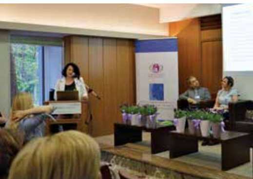
Seminar v Šmarjeških Toplicah, 2018