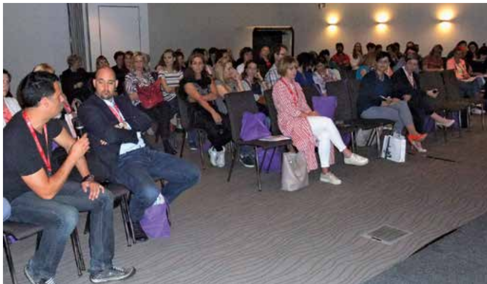
Udeleženci dvodnevnega kirurškega seminarja v Kongresnem centru Thermana Laško