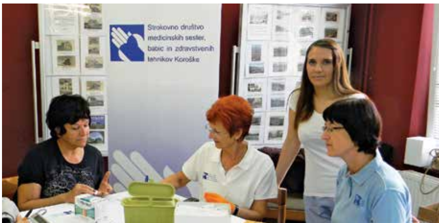
Članice na Jesenskih srečanjih 2017 na Prevaljah