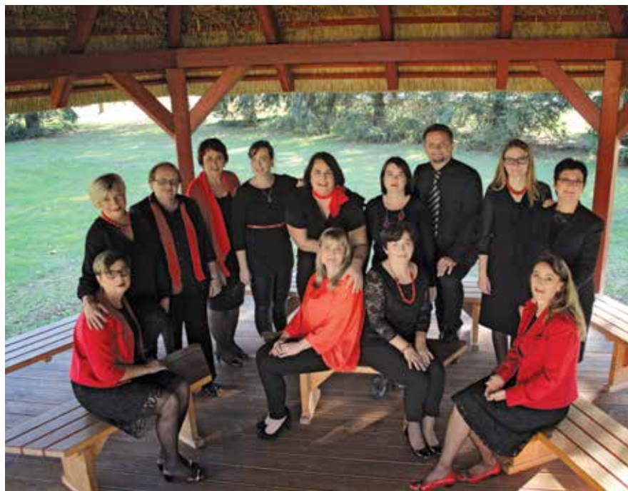
Aktivnosti društva