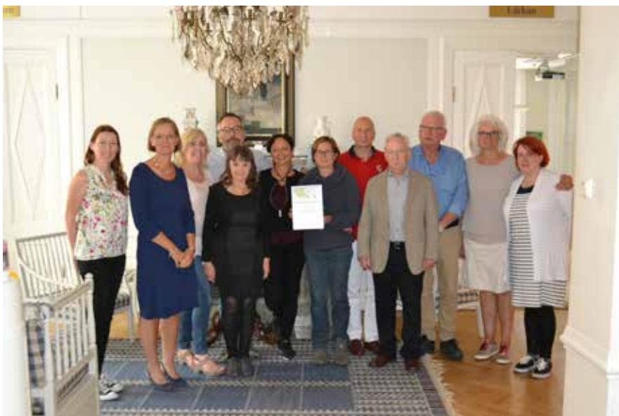
Članice in člani 45. srečanja FOHNEU v Stockholmu na Švedskem