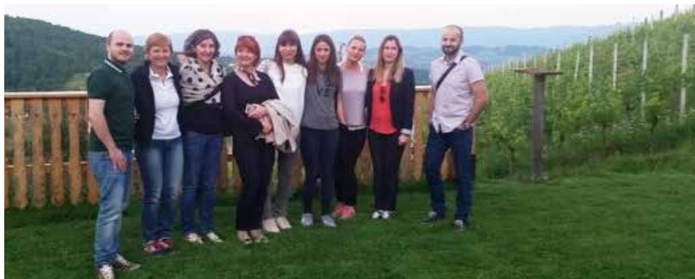
Družčina na posestvu Deu