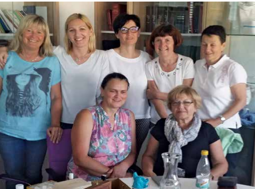
Članice SDSPZN