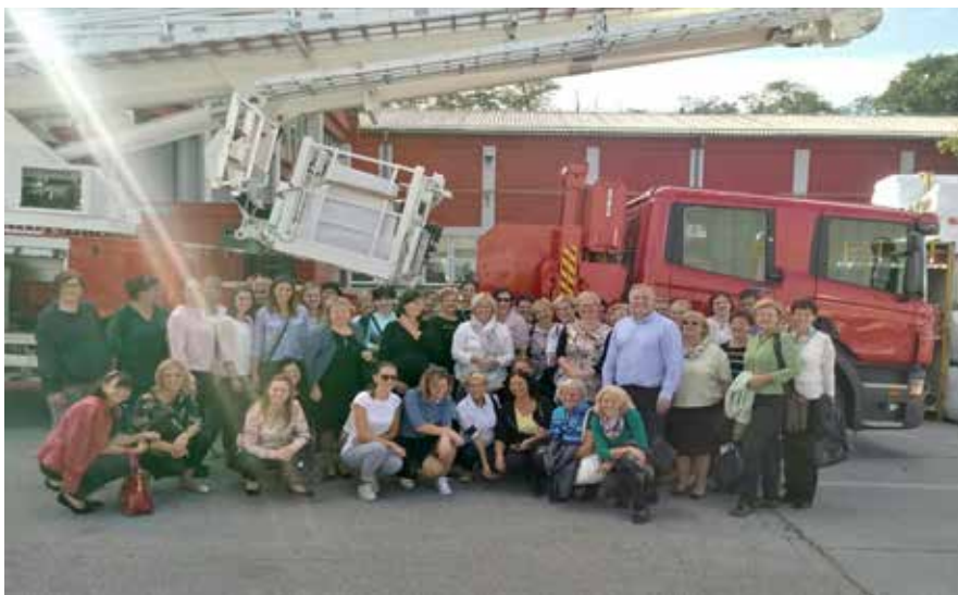
Udeleženci strokovnega srečanja na ogledu delovnih mest v tovarni Rosenbauer