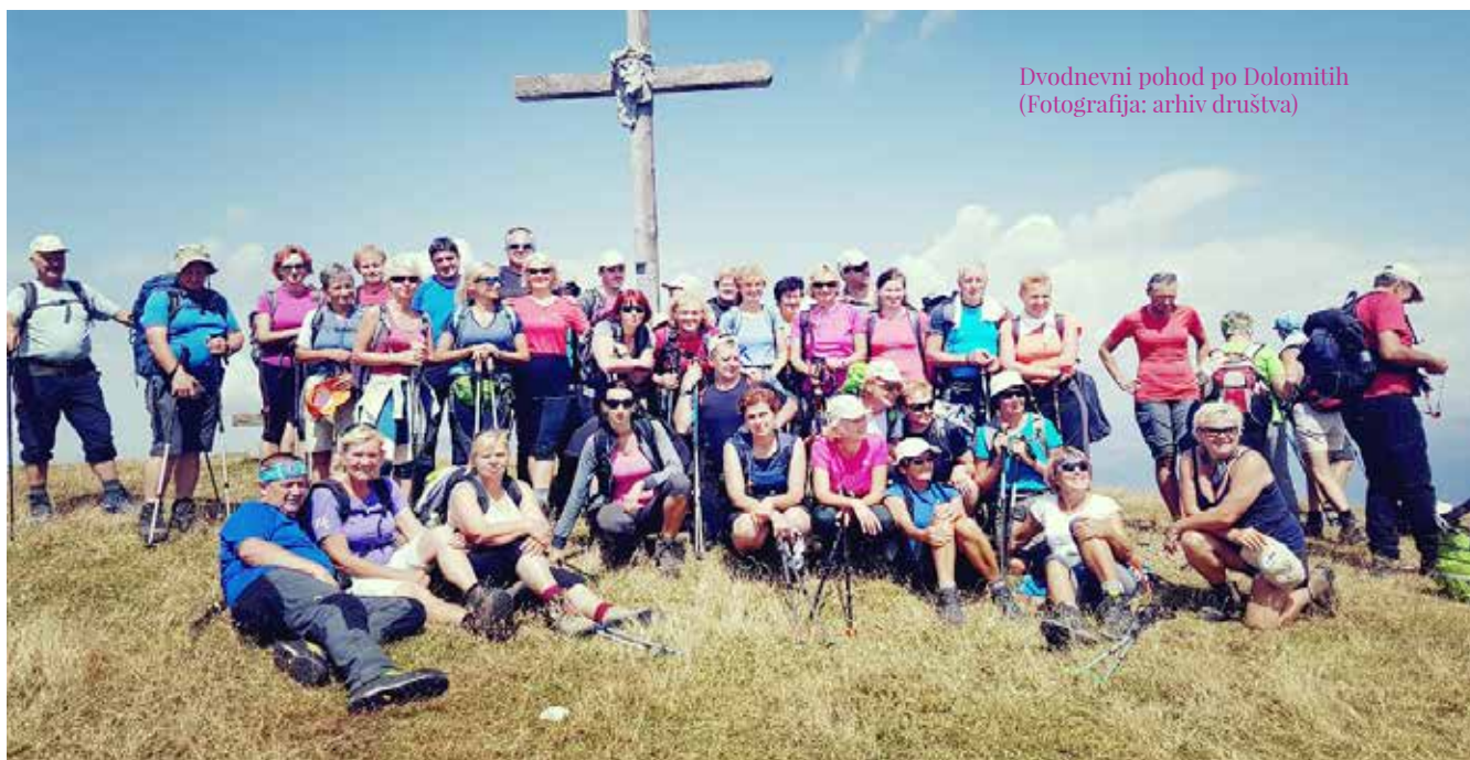
Dvodnevni pohod po Dolomitih