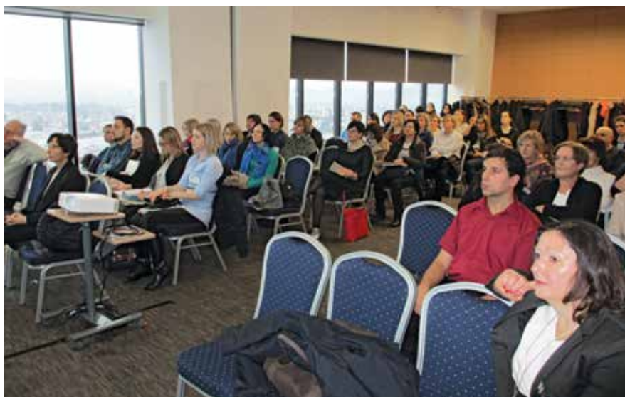
Udeleženci 1. mednarodnega simpozija vaskularne nevrologije