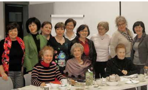
Sestanek delovne skupine za zgodovino v razširjeni sestavi, 2017