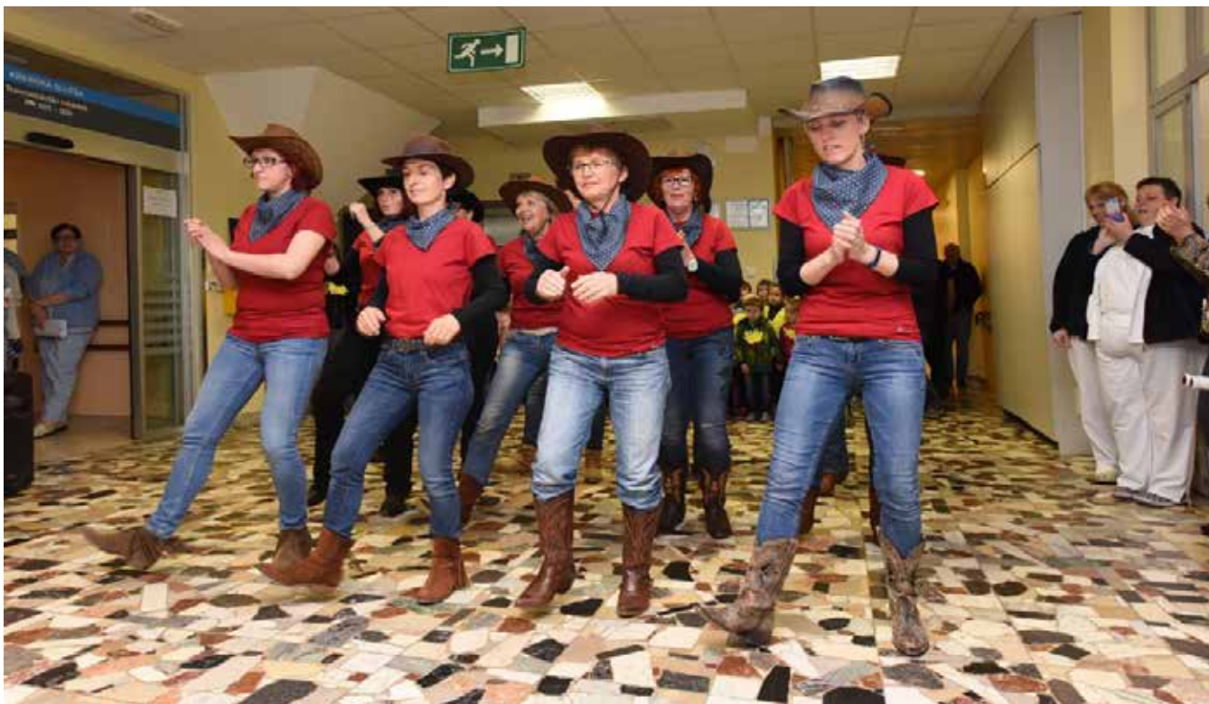
Country ples udeleženk društva ob svetovnem dnevu higijene rok, ki je sovpadal z mednarodnim dnevom babic, 5. majem.