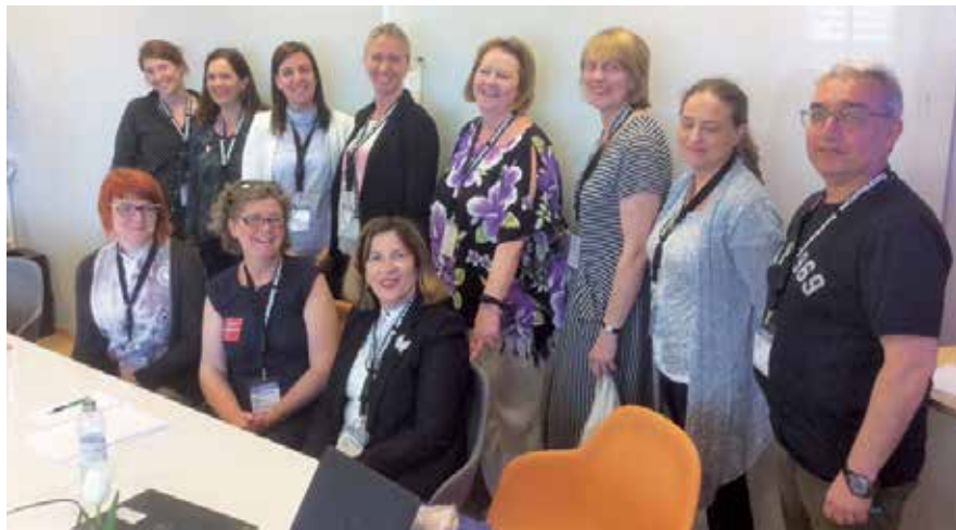
Sestanek CCNAP skupine

Tokrat so bile teme strokovnega srečanja pregled razvoja medicine in zdravstvene nege na področju kardiologije in angiologije, kardiološki bolnik s pridruženimi boleznimi, kot so sladkorna bolezen, ledvična insuficienca, pljučna obolenja in alergija, bolnik s povišanimi maščobami v krvi, bolnišnične okužbe. Pripravili smo tudi sklop učnih delavnic, v katerem so bile predstavljene naslednje teme: uporaba in namestitve osebni zaščitnih sredstev, snemanje EKG-ja, pravičen odvzem kužnin pri sumu na M. tuberculosis, iskanje strokovne literature. Srečanje je bilo zelo dobro obiskano in udeleženci so v anketnem vprašalniku pohvalili zelo zanimive in poučne teme, ki so bile predstavljene na srečanju in ravno tako dobro organizacijo srečanja s spremljajočim programom.