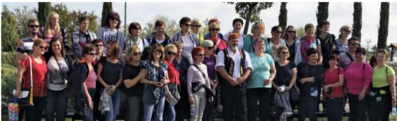
Oktoberški izlet DMSBZT Celje po Dalmaciji in Bosni