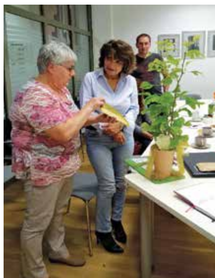
Zaključek projekta asistirana peritonealna dializa, 2018