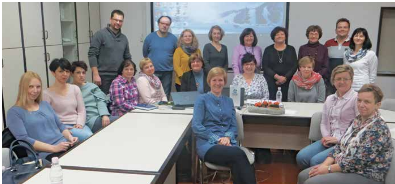
Slika IO društva