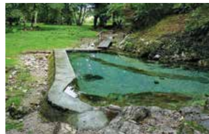
Kamnit bazen v Klevevžu