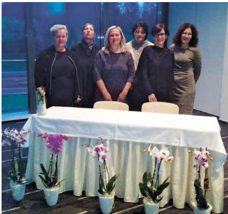
Članice IO ob zaključku strokovnega srečanja V znanju je moč