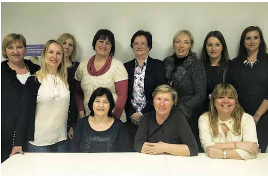
Upravni odbor DMSBZT Koper