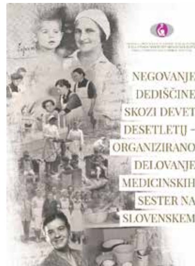
Naslovnica knjige Negovanje dediščine skozi devet desetletij – organizirano delovanje medicinskih sester na Slovenskem, 2017 (Oblikovanje: Barbara Kralj).

Delovno skupino je v letu 2017 zaznamovala izdaja knjige Negovanje dediščine skozi devet desetletij – organizirano delovanje medicinskih sester na Slovenskem , ki je izšla 27. 11. 2017 ob 90-letnici organiziranega delovanja medicinskih sester na Slovenskem in so jo ta dan prejeli vsi udeleženci slavnostne akademije v Kongresnem centru Brdo na Brdu pri