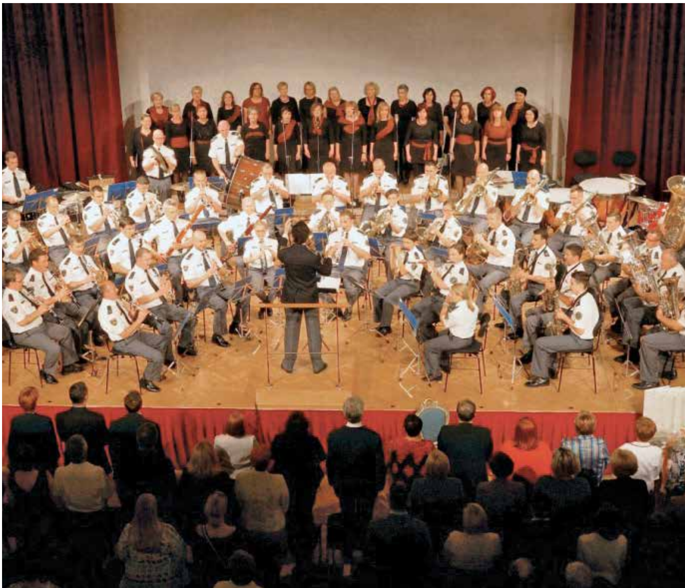
Slovesnost ob 70-letnici društva