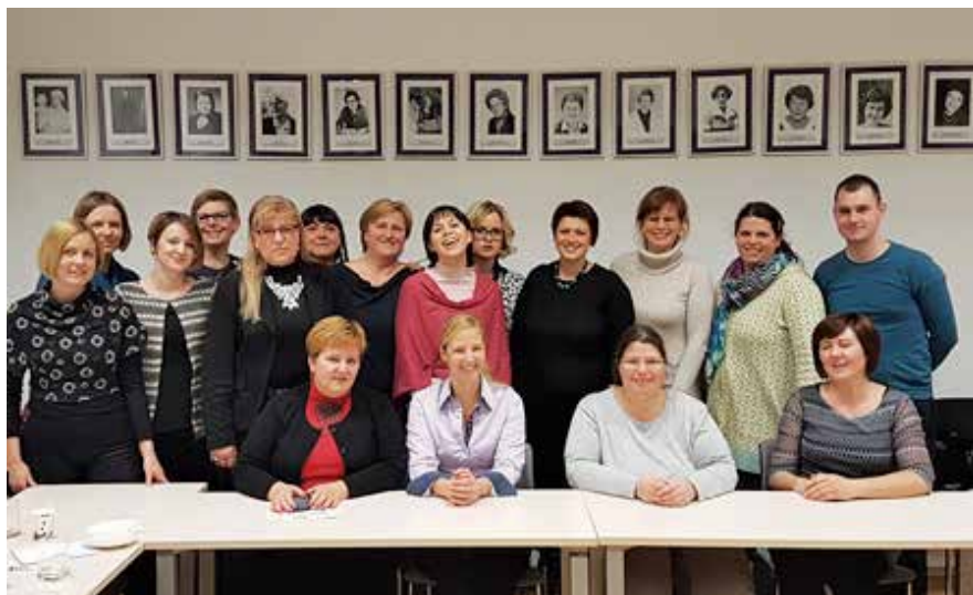
Slika širšega IO sekcije