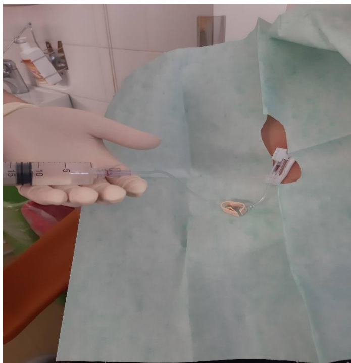
Slika 1: Prebrizgavanje varne atravmatske igle