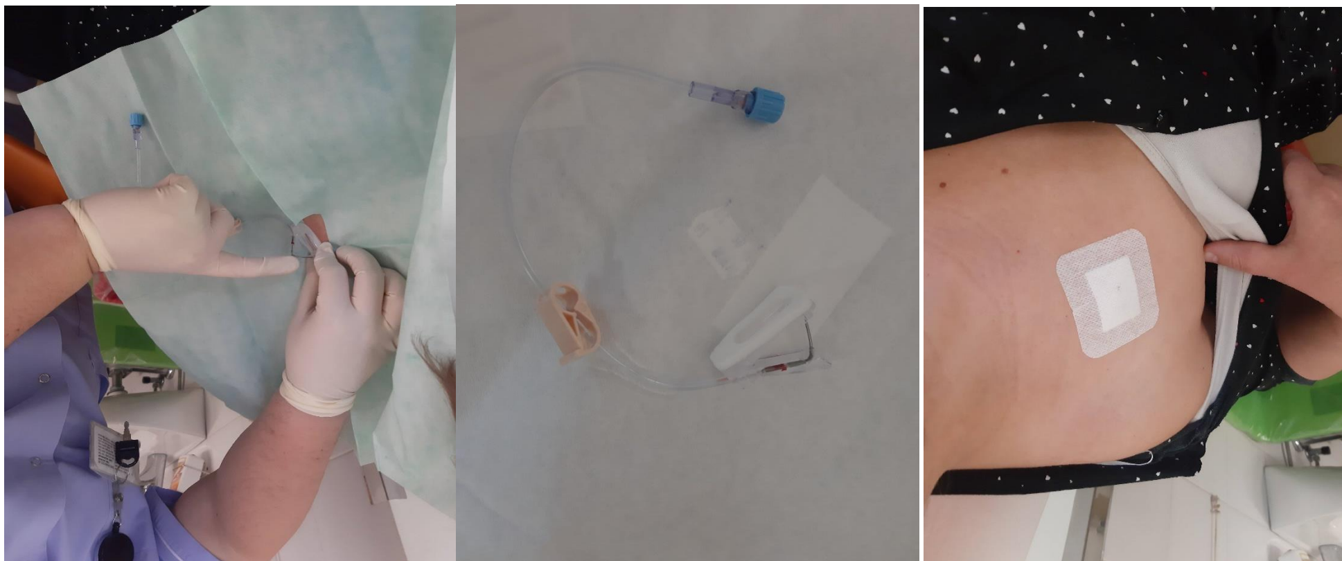
Slika 2: Odstranitev varne atravmatske igle