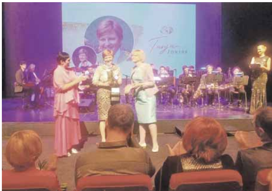
Podelitev zlatega znaka v Cankarjevem domu