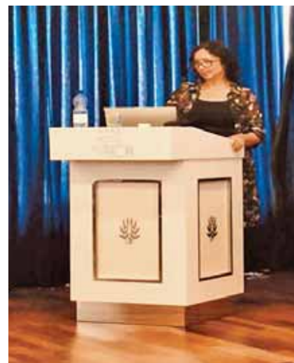
Predsednica strokovne sekcije

Dvodnevni strokovni seminar je bil zelo dobro obiskan in udeleženci strokovnega srečanja so bili navdušeni nad vsebino in izvedbo srečanja.