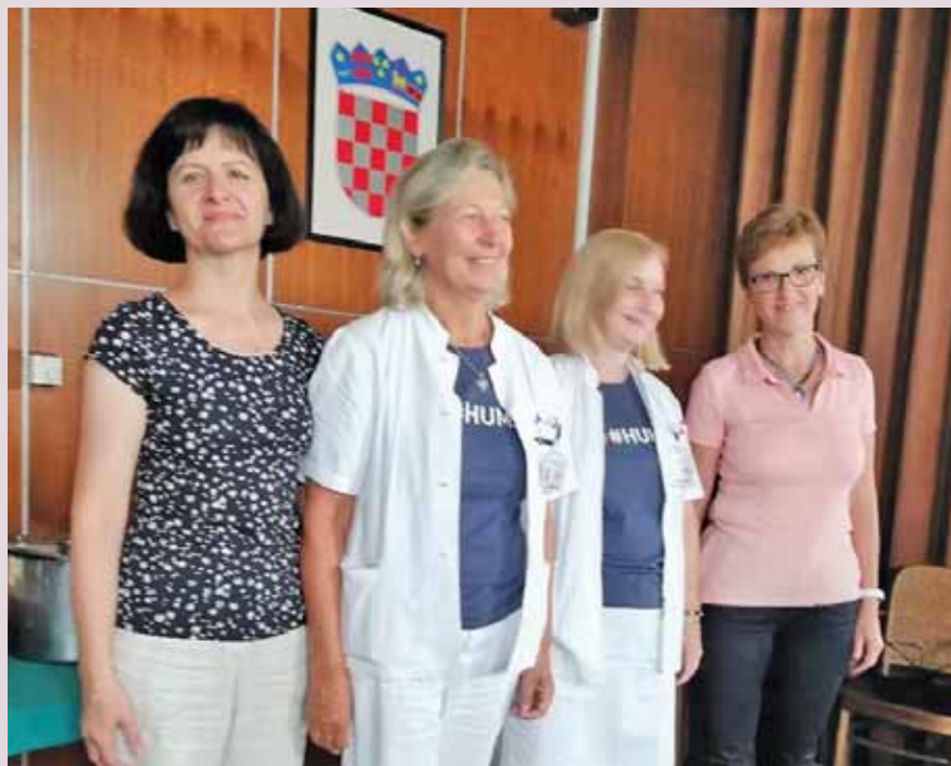
Srečanje z varaždinskimi kolegicami, 17. 8. 2018