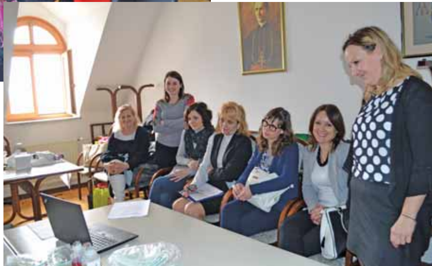
Učna delavnica