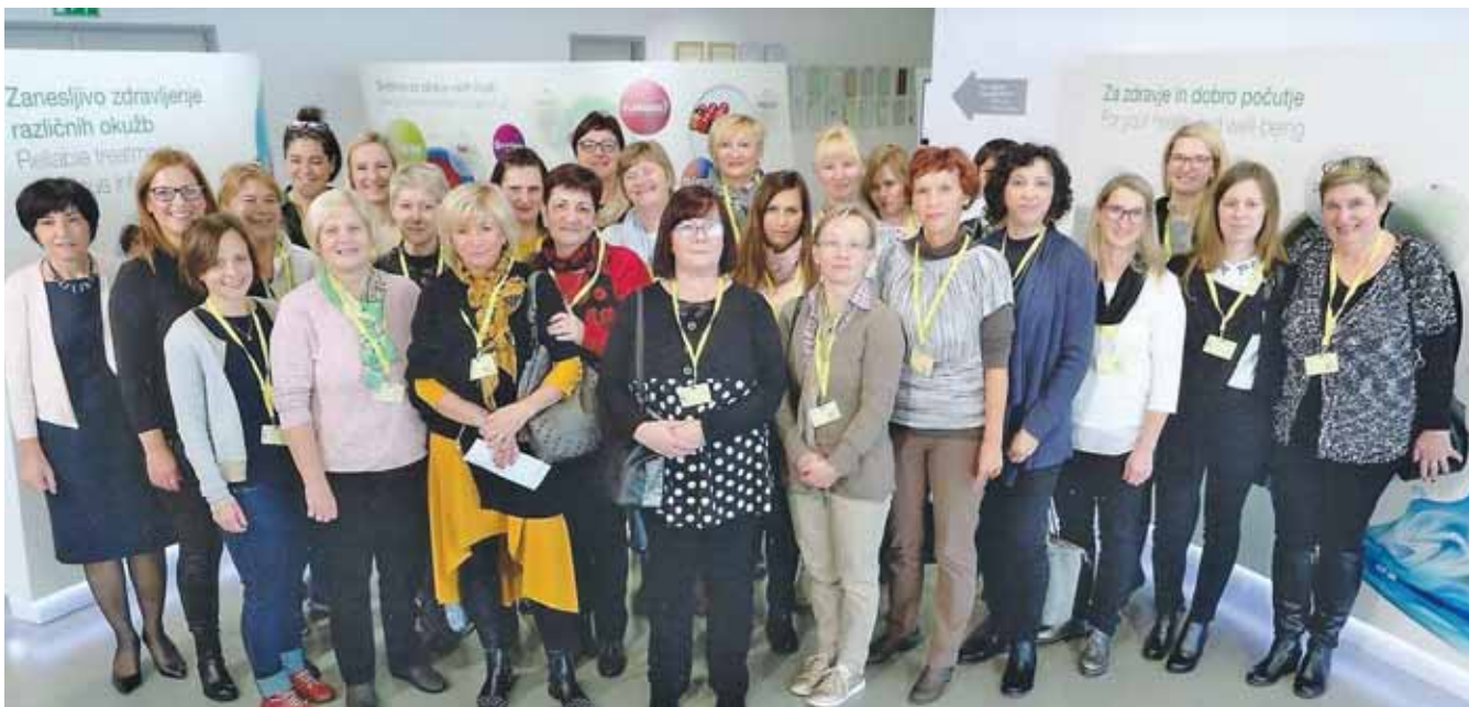
Strokovno srečanje Biološka zdravila v dermatovenerologiji