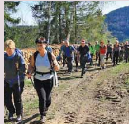
Reška planina, 2018