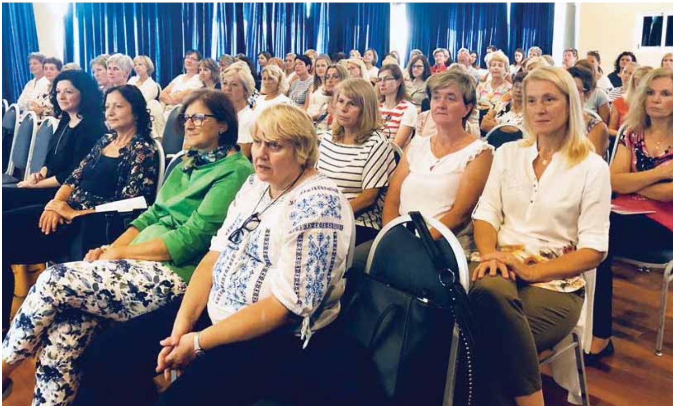
Udeleženci strokovnega srečanja