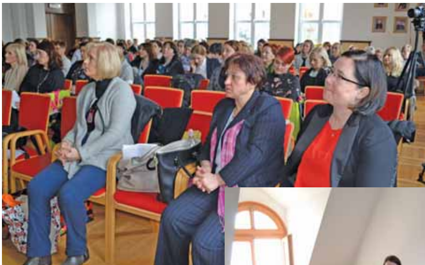
Udeleženci seminarja

teoretičnimi znanji ter praktičnimi veščinami. Udeleženci smo lastna znanja in veščine znova osvežili ter nadgradili. Tudi v prihodnje si želimo, da nam strokovnjaki različnih poklicev in kolegice iz kliničnih in akademskih voda predstavijo novosti v kliničnem okolju in v izobraževanju. Le tako bomo lahko pacientom zagotavljali varno in kompetentno zdravstveno nego in oskrbo ter zadovoljstvo vseh sodelujočim v zdravstveni obravnavi.