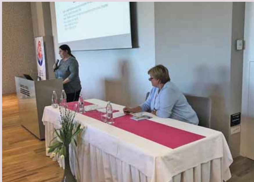
Nagovor predsednice Sekcije MS in babic, Postojna 2018