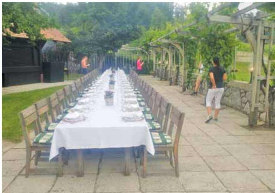
Pogostitev s prekrasnim razgledom