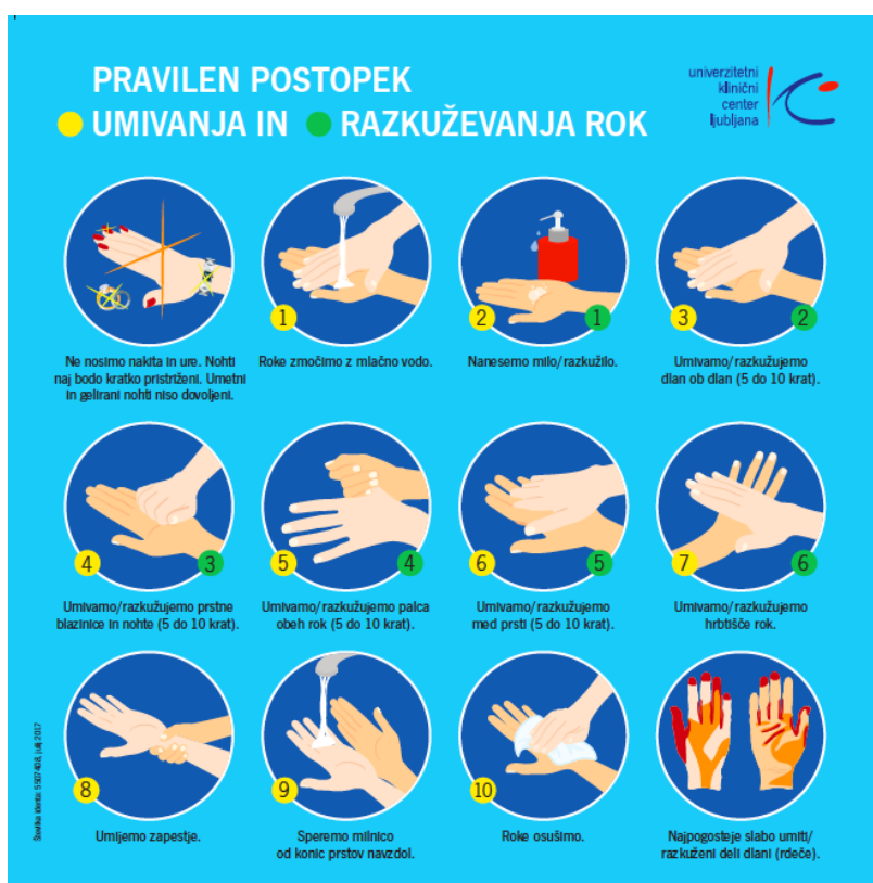
Slika 2: Pravilen postopek umivanja in razkuževanja rok