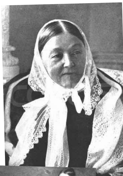
Florence Nightingale.

Shetty AP., 2016. Florence Nightingale: The queen of nurses . Arch Med Health Sci [serial online] 4:144-8. Available from: http://www.amhsjournal.org/text.asp?2016/4/1/144/183362 [11.1.2020]