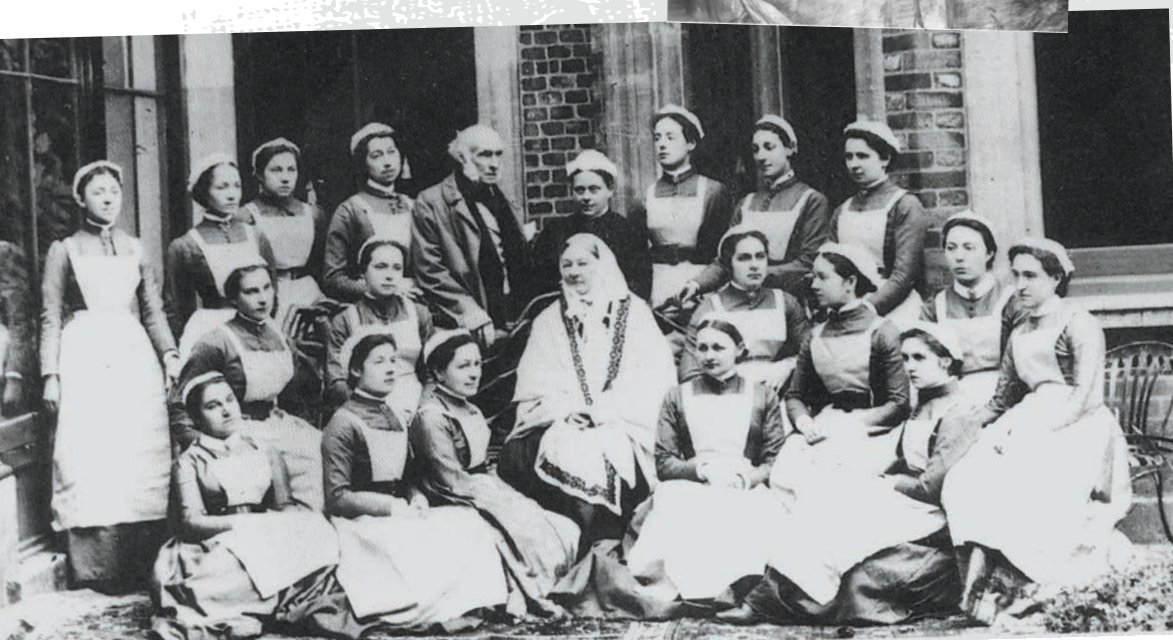
Florence s skupino svojih bolničark.