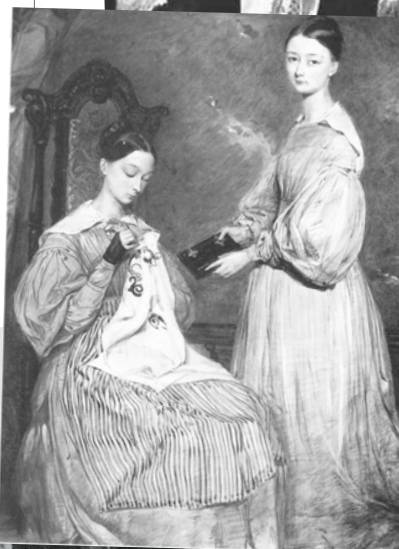
Parthenope in Flo. (Vir: Pam Brown. Knjiga Florence Nightingale. Mohorjeva družba, Celje, 1994. Florence Nightingale. Available at: https://historythings.com/florence-nightingale-lady-lamp/ )