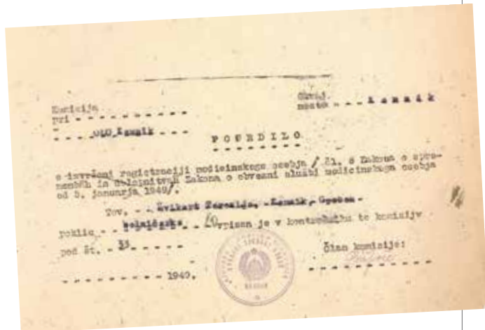
Potrdilo o registraciji medicinskega osebja 1949 (DS ZG Tea Žvikart. Potrdilo o registraciji medicinskega osebja 1949.)

1947 do 1951 je opravljala dela v Splošni ambulanti Kamnik na področju priprave dela in zdravstvene administracije. Od 1955 do 1957 je delala poleg omenjenega še enkrat tedensko pri specialistih: ortopedu, dermatologu, otologu, ginekologu in nevrologu.