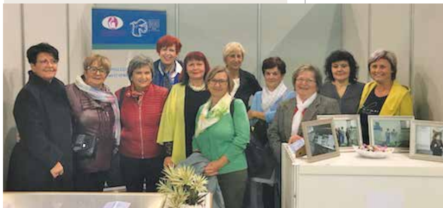
Utrinki z 2. mariborskih dnevov zdravja

Organizatorjema se prijazno zahvaljujemo za povabilo k sodelovanju in v pričakovanju, da bo pri pripravi 3. mariborskih dnevov zdravja s sejmom medicinske opreme organizator DMSBZT Maribor, se veselimo nadaljnega sodelovanja.