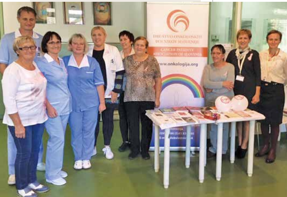
Utrinki s stojnice v SB Ptuj

Skupaj z Društvom onkoloških bolnikov Slovenije, Skupino za samopomoč Ptuj in v sodelovanju s Splošno bolnišnico dr. Jožeta Potrča Ptuj smo v prostorih ginekološko-porodnih ambulant pripravili stojnico in obeležili 11. oktober, svetovni dan boja proti bolečini.