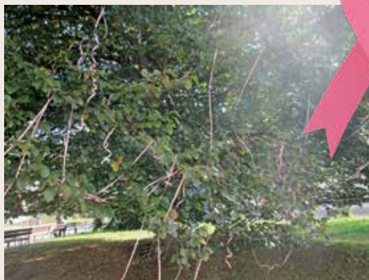
Ob pogledu na drevo, simbolu življenja, ki kljubuje bolezni