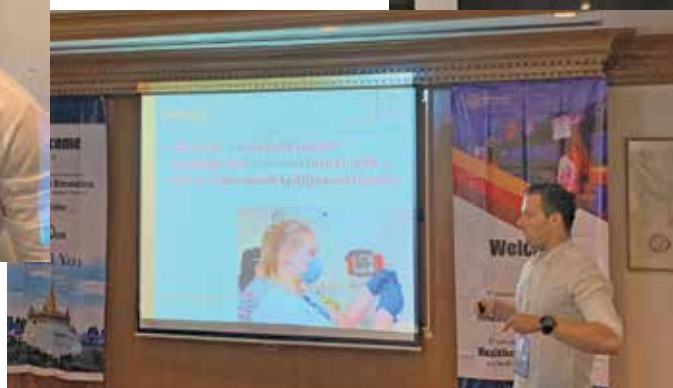
Potovanje mobilne simulacijske enote