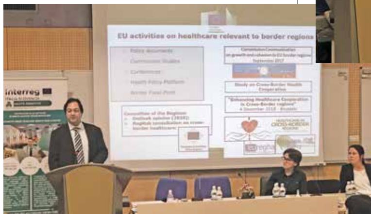
Utrinki s konference