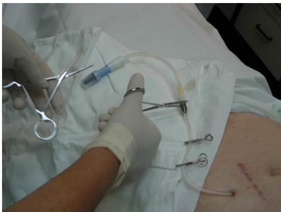
Pretočni set še lahko z občutkom dodatno privijemo s peanoma