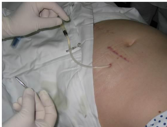
Zapremo navoj na pretočnem setu