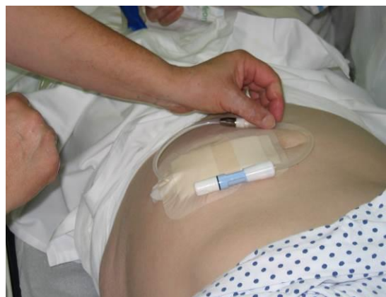
Dobro zaščitimo izstopišče peritonealnega katetra