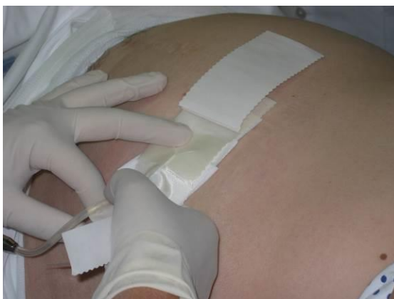
Na koncu (ali med menjavo dializne raztopine) še naredimo toaleta izstopišča peritonealnega katetra