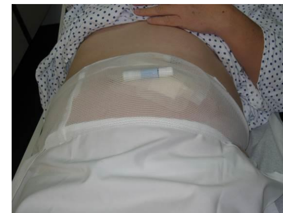
Nato imobiliziramo peritonealni kateter in pretočni set na bolnikovo telo