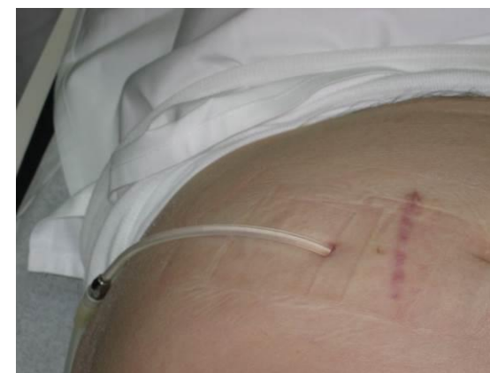
Roke si temeljito razkužimo; Odkrijemo izstopišče peritonealnega katetra; Nato si ponovno razkužimo roke