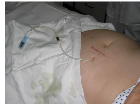
Šele potem odstranimo ščipalki z katetra (če ne bomo delali takoj zamenjave dializne raztopine zamenjamo plastično zaščito s pretočnega seta z novim jodovim pokrovčkom za pretočni set)