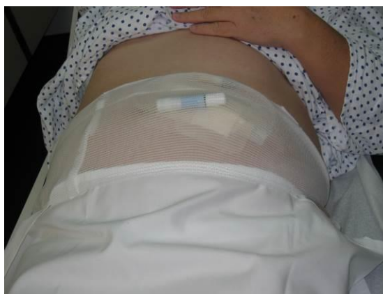
Odgrnemo bolnikova oblačila, tako da nas ne bodo motila pri izvedbi posega