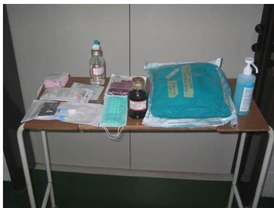
Na razkuženo delovno površino si pripravimo ves material, ki ga bomo rabili za zamenjavo pretočnega seta