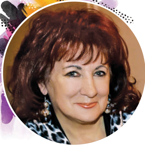
Vlasta Nussdorfer, varuhinja človekovih pravic Republike Slovenije

V okviru institucije Varuha se letno udeleži ali izvede preko 400 različnih dogodkov, mnogi so namenjeni ranljivim skupinam, ki jim posveča vso pozornost.